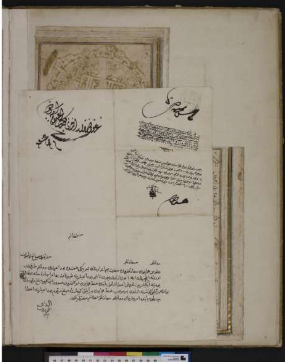
EK-3: Prusya elçisine günlük 200 şer yüz akçeden verilen tayinat bahası ve hane kirası ile ilgili Berlin Devlet Arşivi Doğu El Yazmaları Koleksiyonundan bir belge, (Diez A fol. 74, Diez-Album (A fol. 74), http://orient-digital.staatsbibliothek-berlin.de (13.07.2017).